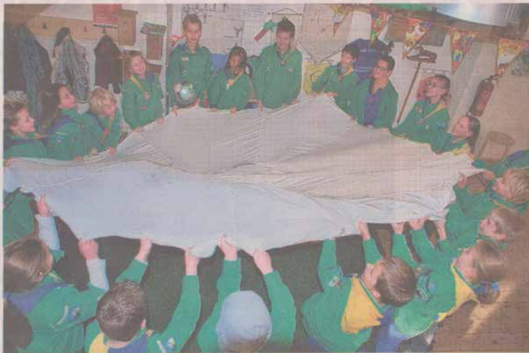
Scouting is de grootste jongerenorganisatie ter wereld, in Harderwijk is men al tachtig jaar actief.