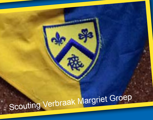
Scouting Verbraak Margriet Groep