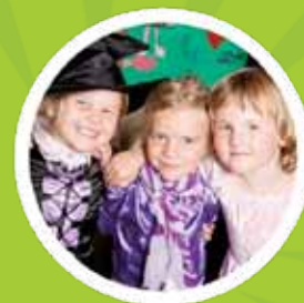
BSO Het Talent