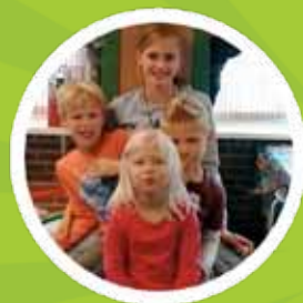
BSO De Veste