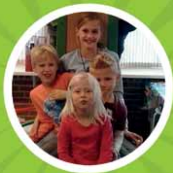
BSO de Veste