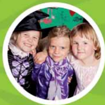
BSO het Talent