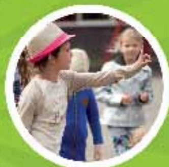
BSO het Talent