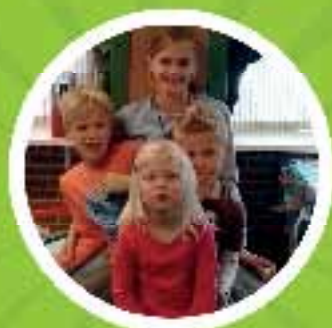
BSO de Veste